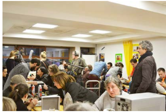
2013. november 30-án tartott Javító Kávézó esemény az Espace Riquet helyiségeiben, Párizsban

Mivel a kezdeményezés újnak számított Párizsban, a média igen kíváncsi volt a tevékenységünkre, és eljöttek filmezni, interjút készíteni és fotózni. Valamennyi Párizsban tartott Javító Kávézó rendezvény nagy sikert aratott: a legutolsó alkalommal például valamennyi mesterember „órarendje” túlságosan is betelt. Úgy látszik, hogy Párizsban a Javító Kávézókra nagy jövő vár. A kezdeményezésről egyre több ember szerez tudomást. 2014 április 5-én – az első születésnapunkon – megtartottuk a „Segítés és Javítás Ünnepe” a Fenntartható Fejlődés Nemzeti Hetének részeként. Ezt az eseményt feltüntették az ESS Minisztérium honlapján is. Nagy rendezvény volt konferenciákkal és olyan meghívott szakértőkkel, akik egész Európából jöttek – még az első holland alapítók is részt vettek az eseményen.