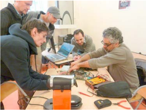
2013. április 6-án tartott Javító Kávézó esemény a Maisons des Associations helyiségeiben, Párizsban